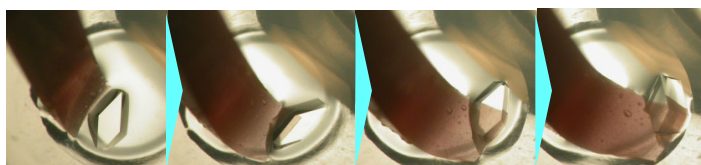
【使用イメージ】 ※写真はCR-100を使用